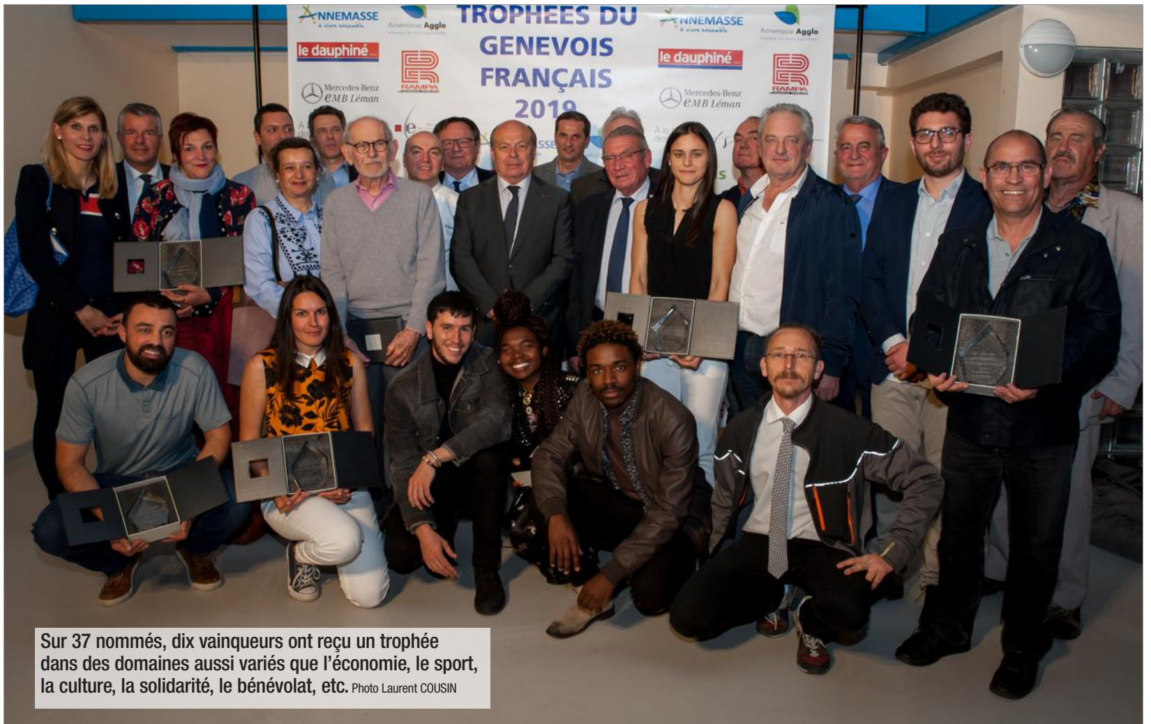
Sur 37 nommés, dix vainqueurs ont reçu un trophée dans des domaines aussi variés que l'économie, le sport, la culture, la solidarité, le bénévolat, etc.