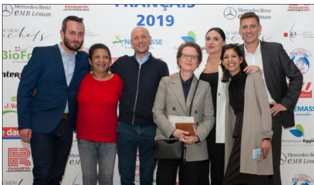
Une partie de l’équipe commerciale et la rédaction du Dauphiné Libéré ainsi que la Ville d’Annemasse, avec d’autres partenaires, ont décerné des trophées pour récompenser les initiatives des Annemassiens.