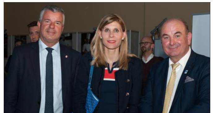
Les invités, parmi lesquels les députés Martial Saddier (à gauche) et Virginie Duby-Muller, ont assisté à la révélation du palmarès dans la grande salle du complexe Martin-Luther-King.